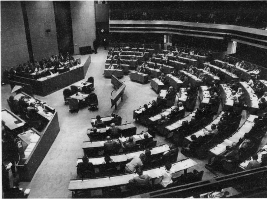
Een overzicht van de nieuwe indeling in de Tweede Kamer.

Voorzitter! Mooie zinnen, die harde maatregelen uit het regeerakkoord ook verbloemen en voor een deel er haaks op staan. De minister-president heeft gelijk als hij zegt, dat op 3 mei jl. het politieke landschap een beetje op zijn kop is gezet. Hij vergeet er overigens bij te zeggen, dat het van de kiezer een duidelijke keuze is voor verandering. Hij zou er twee conclusies uit kunnen trekken. De coalitie, op dat moment bestaande uit het CDA en de PvdA kregen een flink pak slaag. Verder: de enige interpretatie is een paarse coalitie. De kiezer wilde verandering en kreeg verandering.