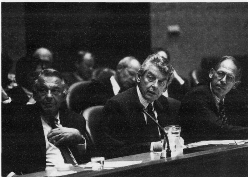
V.l.n.r. de heer Van Mierlo, minister van Buitenlandse Zaken, Minister-President Kok en de heer Dijkstal, minister van Binnenlandse Zaken.

vroeger of terug, maar om een hunkering naar evenwicht. Iedereen ziet, in een wereld met zulke nieuwe verhoudingen en met zulke indringende concurrentie, dat dit land echt moet worden aangesproken op alles dat het kan, maar niet ten koste van het uit elkaar drijven van mensen. Met elkaar! Ik vond de regeringsverklaring op dat punt een voorbeeld van evenwichtigheid. Op pagina 9 van de gedrukte versie zegt de minister-president dat het kabinet kiest voor een balans tussen de economische dynamiek en de sociale bescherming, tussen het stimuleren van de individuele verantwoordelijkheid van de burgers en de samenhang en voor een balans tussen economische modernisering en ecologische duurzaamheid. Dat zijn, zou de minister-president gezegd kunnen hebben, grote woorden, maar het zijn precies de woorden waarbinnen het werk van dit kabinet zich zal voltrekken! Ik kan alleen maar zeggen dat de PvdA-fractie dit kabinet op het bereiken van dat evenwicht zal beoordelen, bijsturend waar dat nodig is, maar vanuit een grote verbondenheid met het program en met de mensen in dit kabinet.